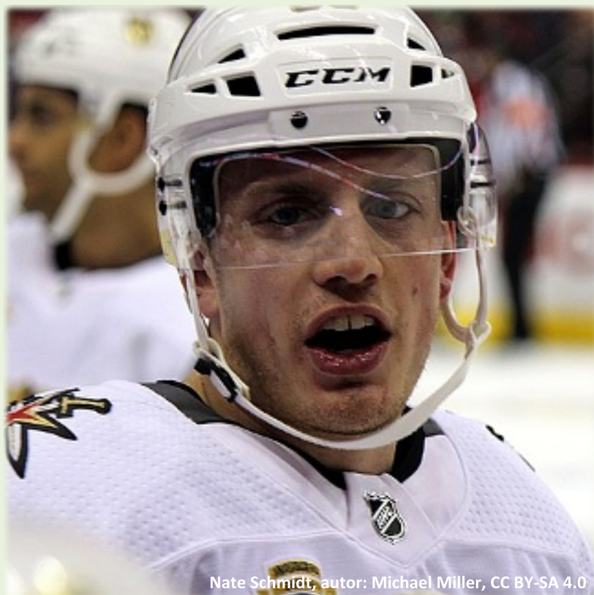
Nate Schmidt

V případě, že se však profesionální sportovci těchto organizací účastní velkých mezinárodních akcí typu mistrovství světa, Evropy a v neposlední řadě i olympijských her, musí se plně a bez výhrad podvolit oficiálnímu a úplnému Seznamu zakázaných látek WADA.