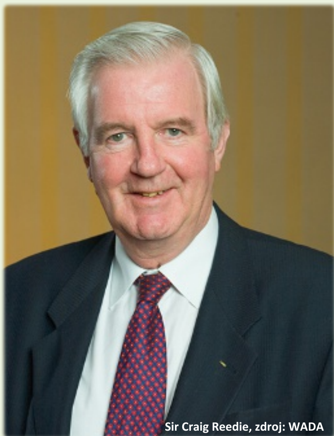
Sir Craig Reedie

Prezident WADA sir Craig Reedie napsal otevřený dopis antidopingové organizaci RUSADA dne 23. září. Z jeho myšlenek vyjímáme následující: