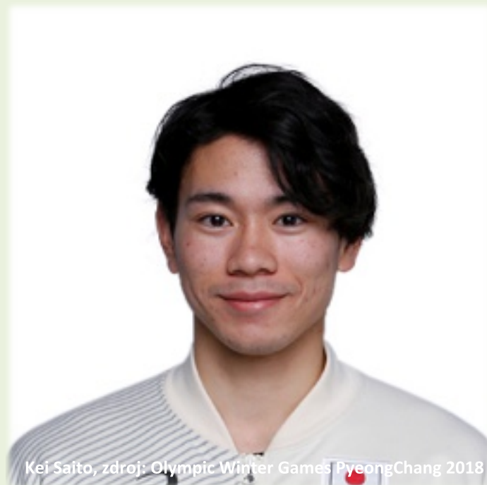
Kei Saito

Hříšníkem se stal japonský reprezentant v short tracku Kei Saito, který měl pozitivní nález na zakázanou látku acetazolamid, která byla zjištěna při mimosoutěžním odběru a následné analýze v laboratoři. Tato látka je diuretikum ze skupiny S5D, která slouží k zakrytí jiných látek, které figurují na seznamu zakázaných látek WADA. Závodník zatím dostal dočasnou sankci pozastavení činnosti, která má však za následek povinnost neprodleně opustit olympijskou vesnici a zákaz startu na olympiádě.