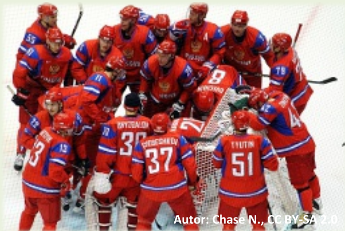
Autor: Chase N., CC BY-SA 2.0

Rozhodnutí Sportovního arbitrážního soudu (CAS) v dopingové kauze ruských sportovců těsně před zahájením zimních olympijských her způsobilo veliký rozruch. S doporučením jak vzniklou situaci řešit, přišel i sám prezident Putin. Svým sportovcům radil mírnit emoce a též nabídl uskutečnit pro potrestané alternativní Hry na olympijských sportovištích v Soči.