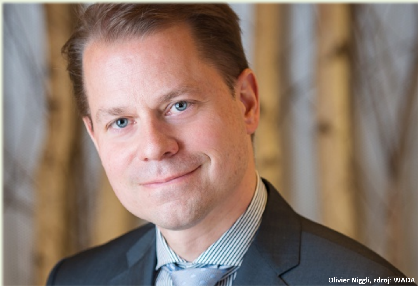
Olivier Niggli

Světová antidopingová agentura WADA přivítala rozhodnutí Soudu pro lidská práva ve Štrasburku, který potvrdil právo národních antidopingových organizací a dalších subjektů provádět i nadále mimosoutěžní odběry sportovců. Souhlasí také s tím, že vybraní sportovci, kteří jsou v příslušných mezinárodních nebo národních registrech, že musí pravidelně hlásit místa svého pobytu a musí udat jednu hodinu denně, kdy jsou závazně k dispozici dopingovým komisařům, kteří provádějí odběry.