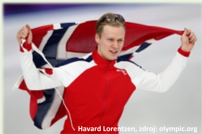
Havard Lorentzen

Na úvod je třeba uvést, že podle seznamu zakázaných látek, který vydává každoročně Světová antidopingová agentura WADA vždy k 30. září s platností od následujícího 1. ledna nejsou léky proti astmatu obsahující salbutamol, formoterol a salmeterol v inhalaci (ve spreji) užívané dle doporučení lékaře zakázané.