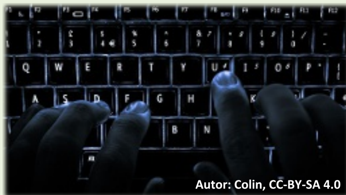
Autor: Colin, CC-BY-SA 4.0

A přesně podle tohoto hesla se řídí ruská skupina „hackerů“, které se podařilo vlámat do systému