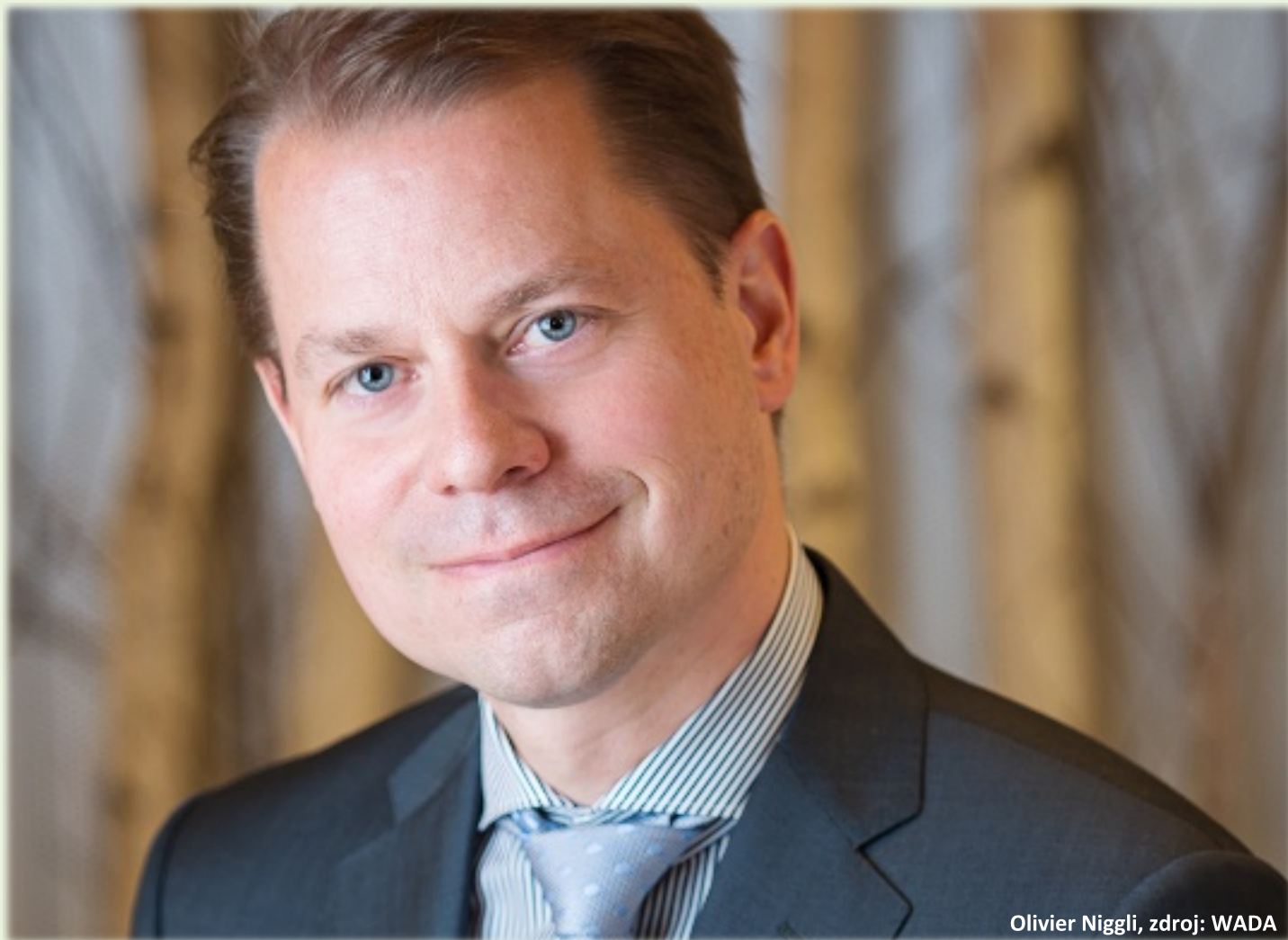
Olivier Niggli

Světová antidopingová agentura WADA zveřejnila výroční zprávu za rok 2015, která má přispět mj. ke zlepšení boje proti dopingu ve sportu.