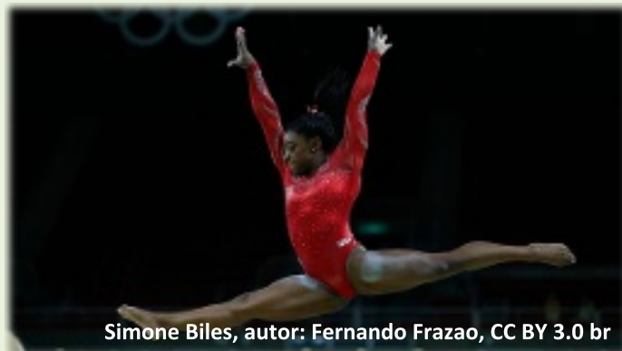
Simone Biles