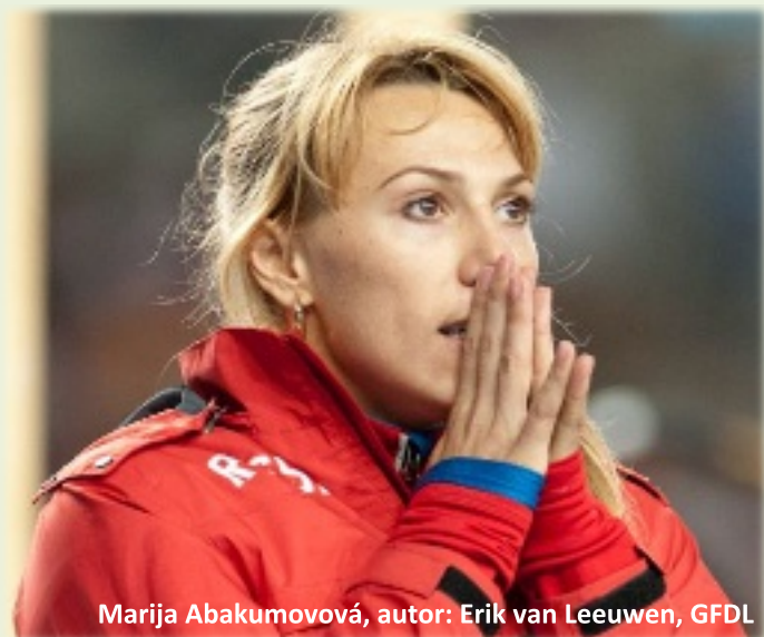
Marija Abakumovová

Soupeřka naší Barbory Špotákové Ruska Abakumovová byla usvědčena z dopingu při Hrách 2008 v Pekingu a musí tak vrátit medaili, kterou dodatečně dostane Němka Obergfoellová a na třetí místo se dostane Britka.